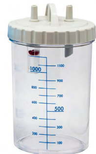
Bocal 1200 ml autoclavable