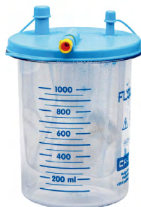
Poche jetable 1000 ml