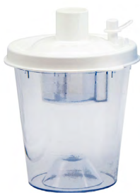
Bocal 800 ml pour patient unique (de série)