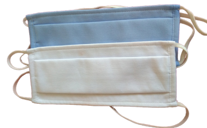
Coloris non contractuels

Pour protéger votre santé et celle des autres, il est très important de respecter cette notice d'utilisation.