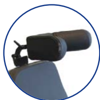
Appui-tête à oreillettes longues et orientables