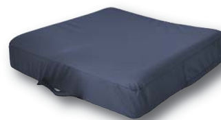
Remplacement du coussin d'assise standard par un coussin d'assise en mousse visco-élastique (agréé classe II).