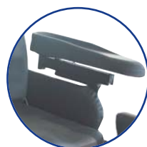
Manchette gouttière mousse visco, réglable et orientable