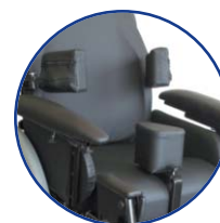
Cale-tronc et plot d'abduction