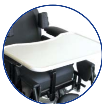
Tablette standard amovible par coulissement